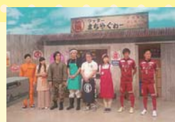
開幕前にOTVの番組に知念選手と出演しました。プロサッカー選手はトークスキルも必要。