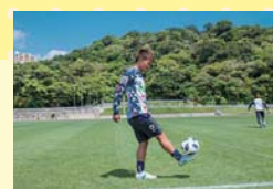
地元でサッカーしたいという気持ちがあったので、J3リーグが出来て嬉しいと思います。