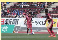
アウェイでの試合は緊張しますが、観客席にサポーターの方の顔を見つけるとほっとします。