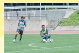
常に周りを見て、次の次まで何が起こるか考えながら全力で練習に取り組んでいます。

なるまで努力をし続けられたのだと思います。まだプロになったばかりですが、これから8年、30歳位までは活躍したいと思っています。そうすれば、セカンドキャリアに繋がるので、引退後もコーチなど一生サッカーに関わる仕事をしたいですね」