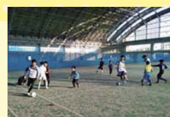
スクールで教えることもありま。そこから将来プロとして活躍してくれる子がいたら嬉しい！