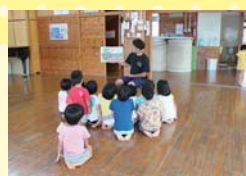
絵本の読み聞かせをします。子ど もたちが年長さんくらいにな ると内容も長く複雑になります。