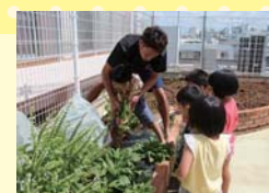
園の屋上には農場があります。 ホウレンソウが立派に育っ ていて、それを抜いていました。