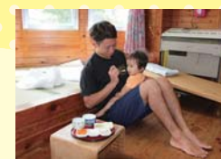
小さな子にはごはんを食べさ せてあげることも。この子は1 歳だそうです。