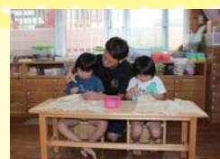
縫い物指導をしています。この ときは針と糸を使って鯉のほ りの制作をしていました。