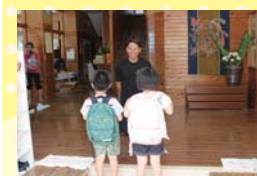
朝は登園してくる子どもたちの 受け入れから始まります。笑 顔で「おはようございます」